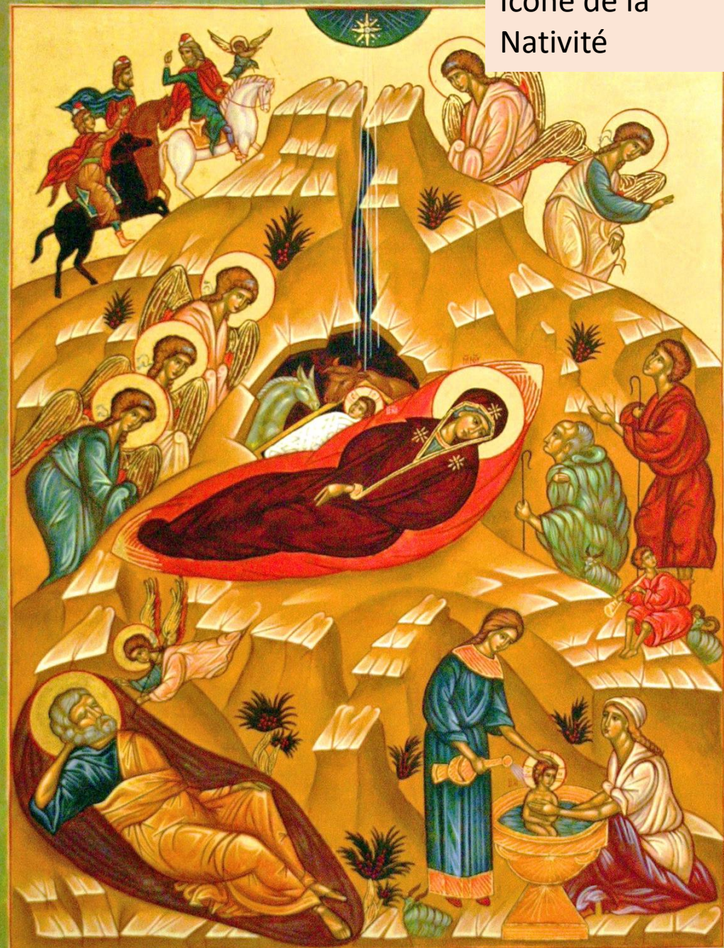
Icône de la Nativité