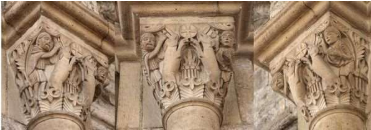
46 - Deux lions affrontés sur une tête d'homme