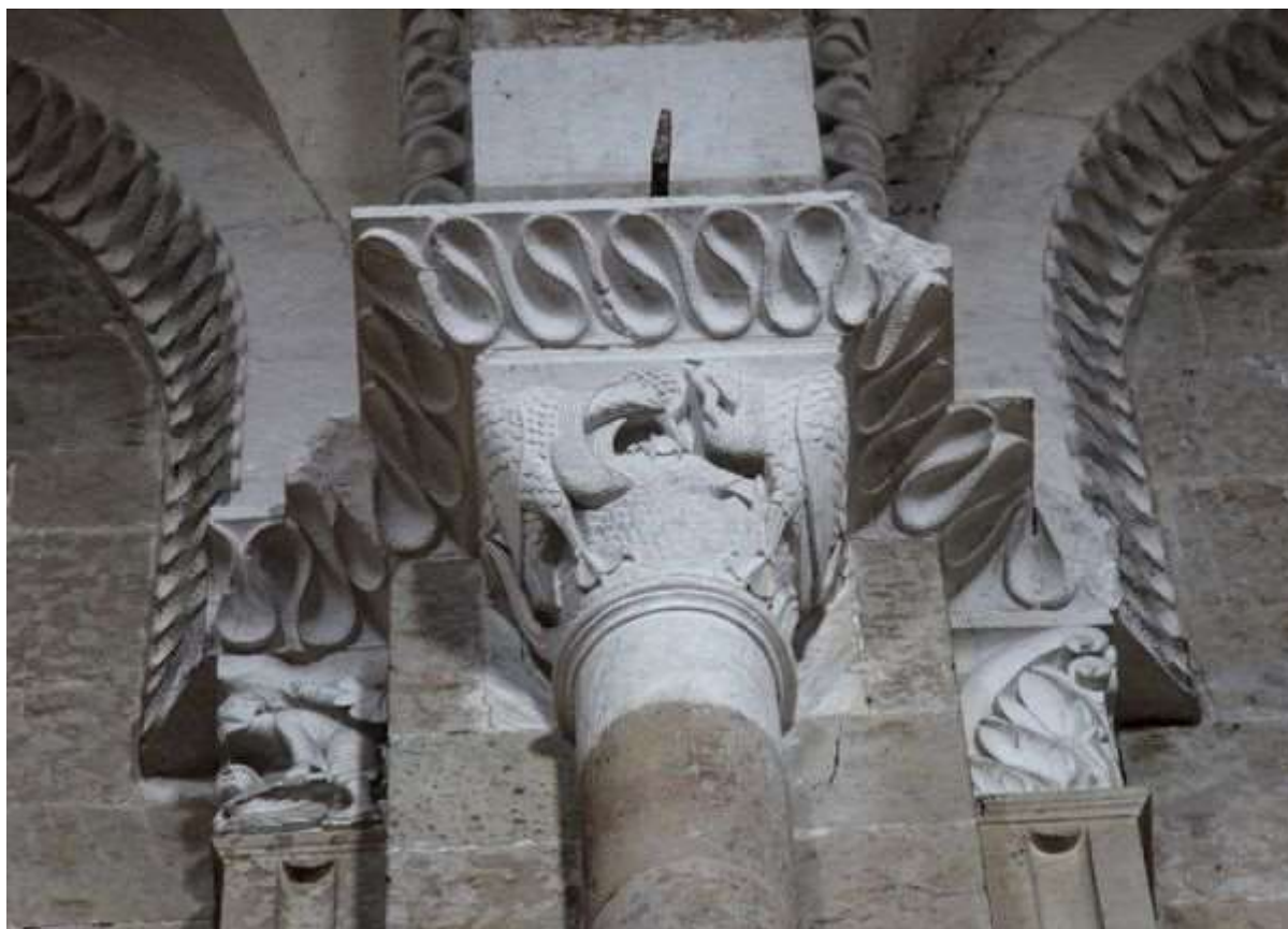
74 - La pendaison de Judas