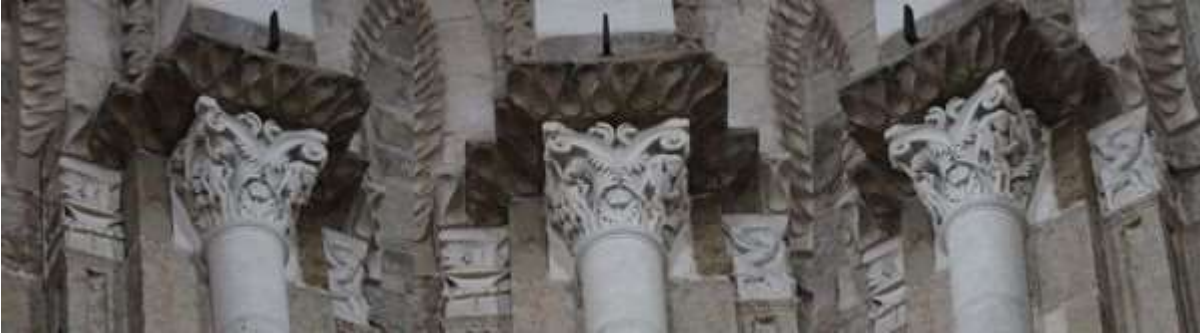
75 - Hérodiade demande à Hérode la tête de Jean