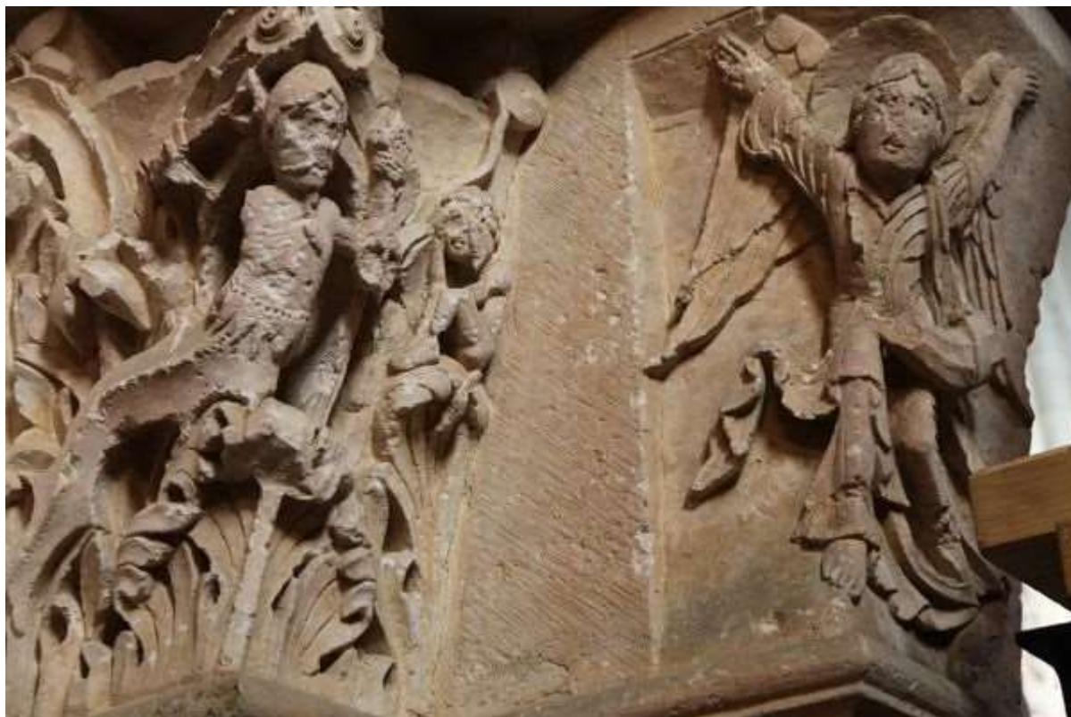
16 - Archer bandant son arc