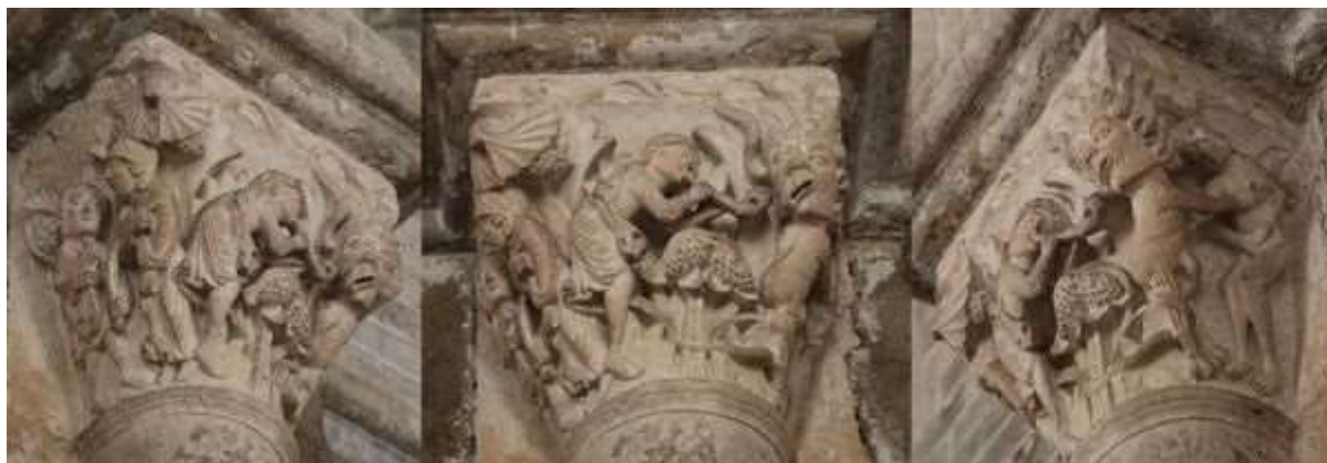
54 - Daniel dans la fosse aux lions