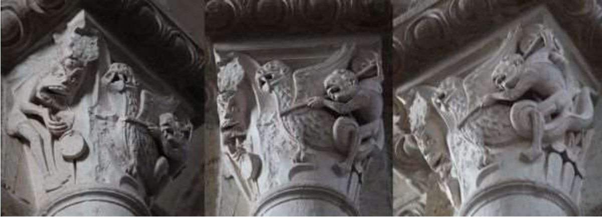
33 - Moïse et le veau d'or