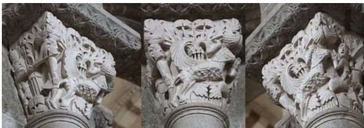
31 - Animaux affrontés (éléphants ?)