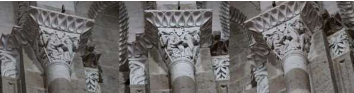
76 - Le meurtre d'Amnon