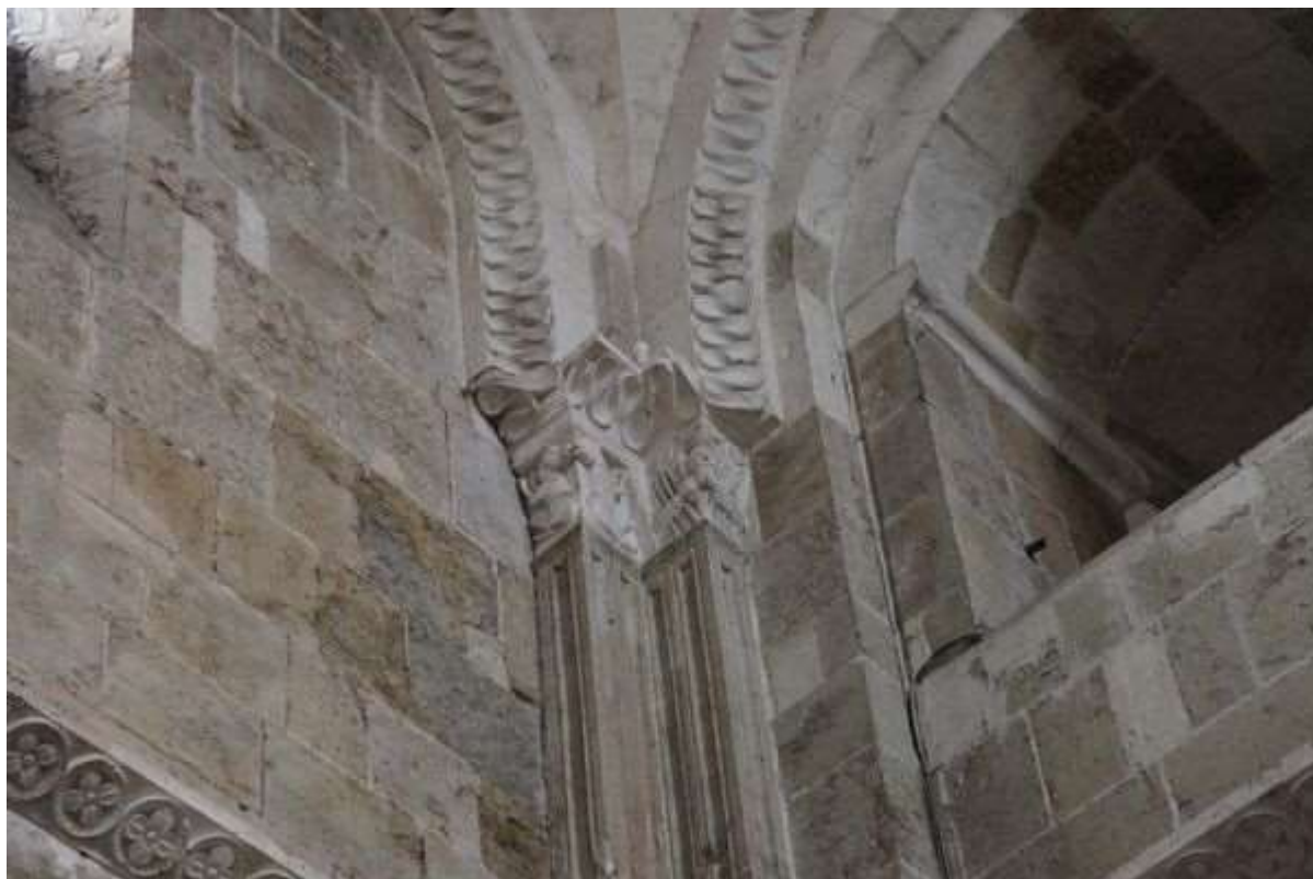
73 - Deux pélicans au-dessus des flots