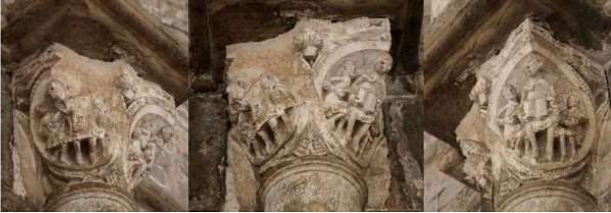
57 - David et le lion