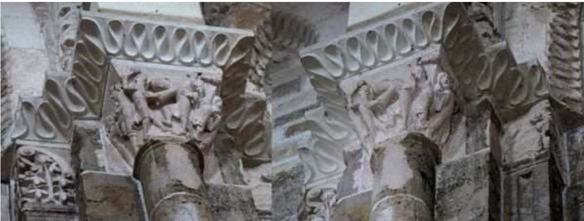
84 - L'abbé de Vézelay rendant la justice

On voit la femme tirant Joseph par son vêtement alors qu'il fait un geste de dénégation. À droite elle le désigne à son mari. À gauche, il est fouetté.