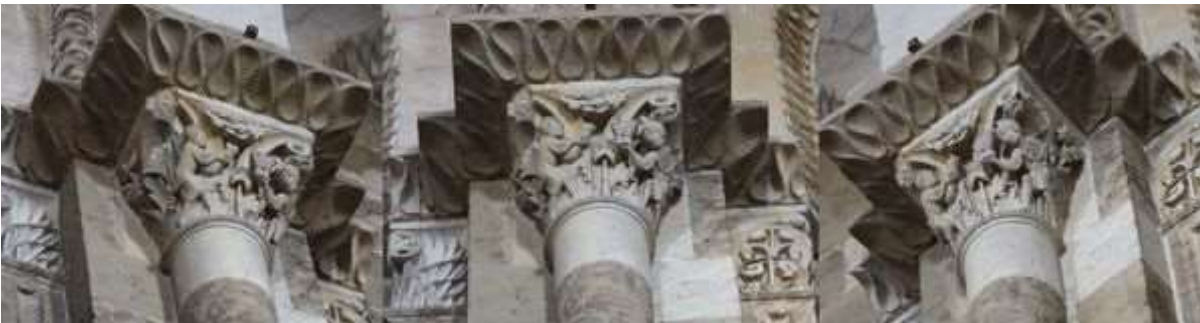
80 - Crucifixion