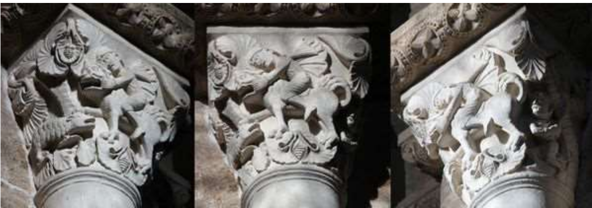
58 - Les quatre vents du paradis

(voir aussi les quatre fleuves du paradis 48)