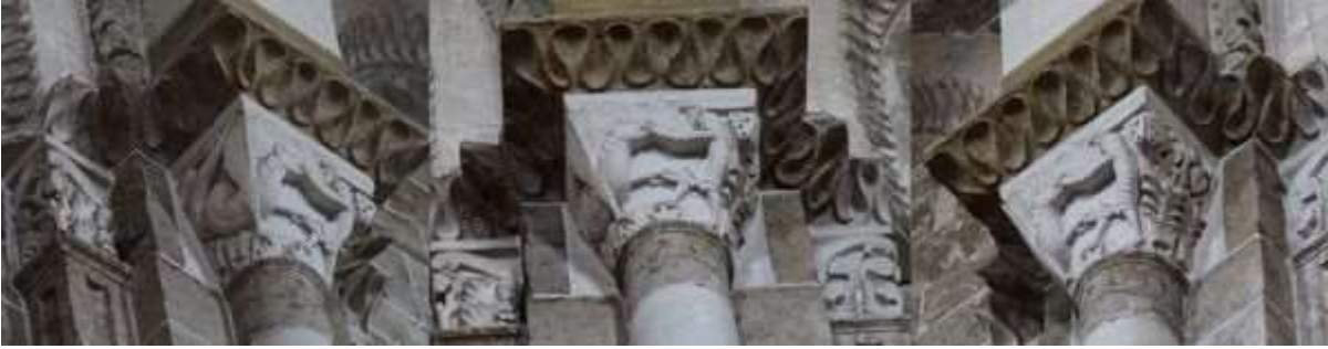
83 haut - Joseph et la femme de Putiphar