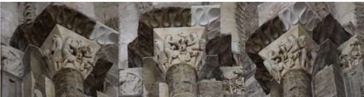
82 - Un guerrier lutte contre un dragon ailé