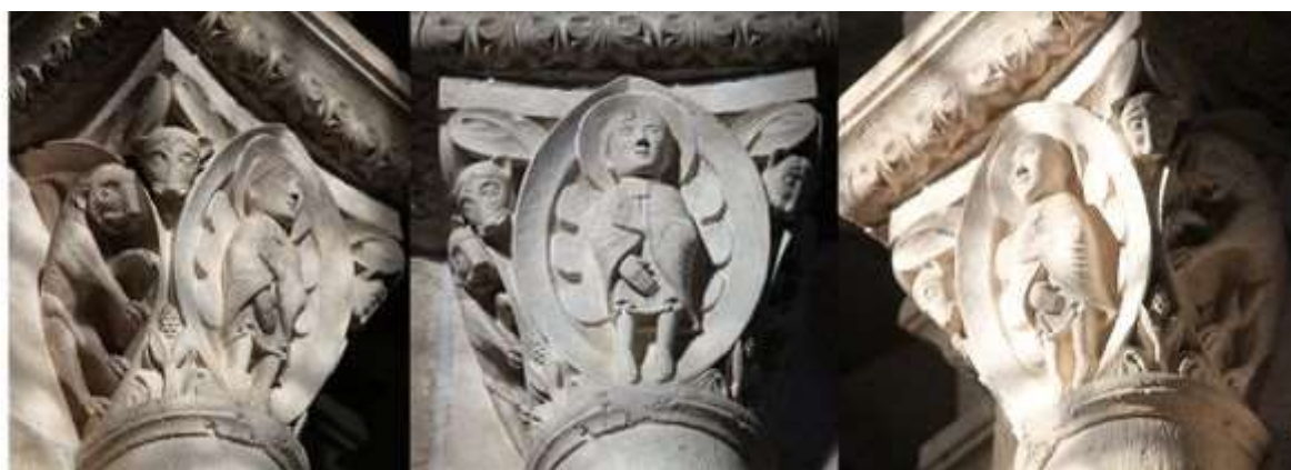
55 - Saint-Martin et l'arbre des païens