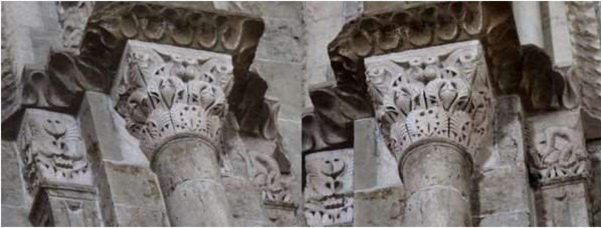
86 - Samson et Dalila