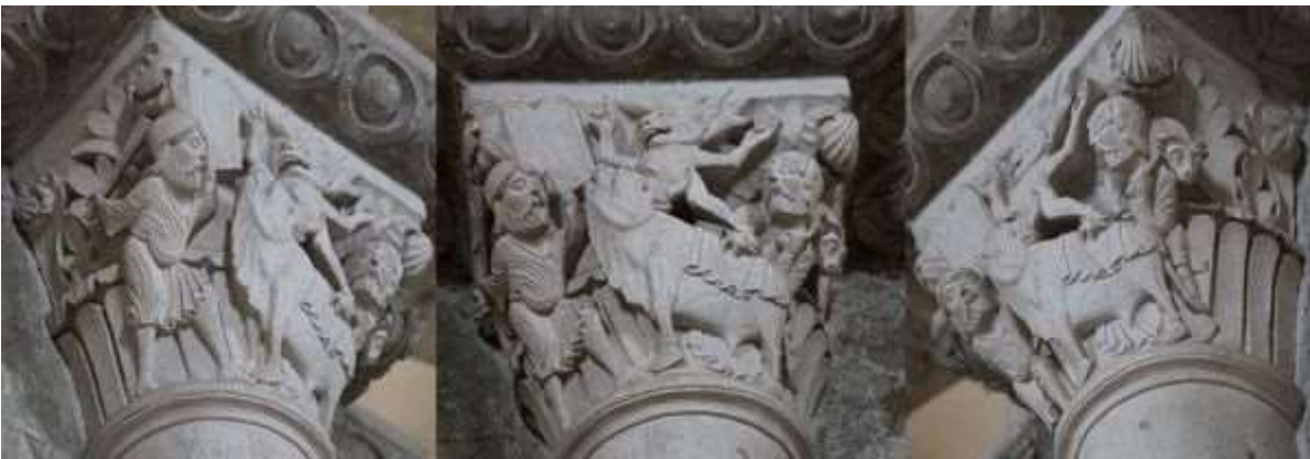
34 - L'ange exterminateur décapitant le fils de Pharaon