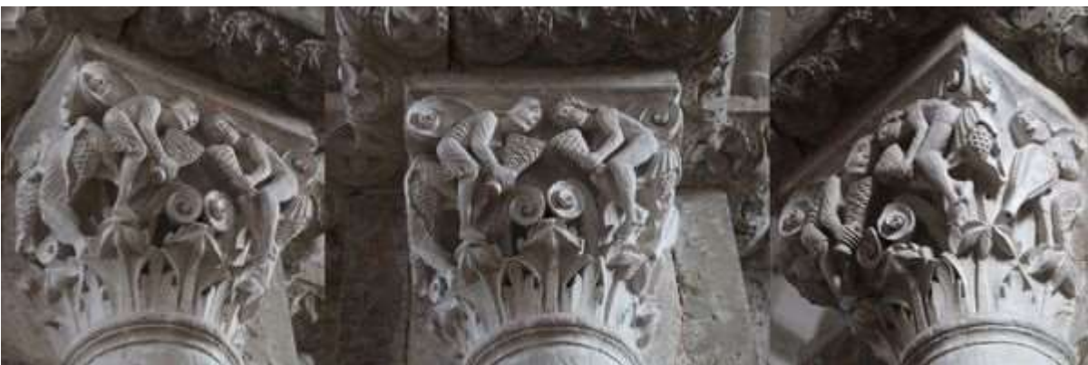
59 - La mort de Caïn

(voir aussi les quatre fleuves du paradis 48)