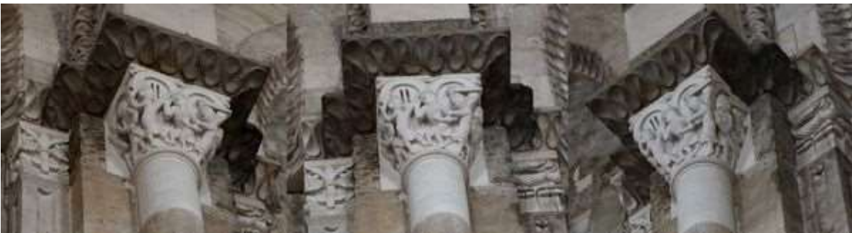
77 - La construction de l'arche de Noé