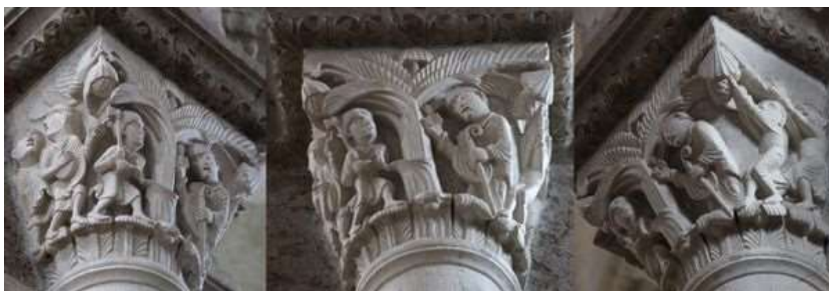
56 - Maître et écoliers

À droite le personnage tient un livre ouvert