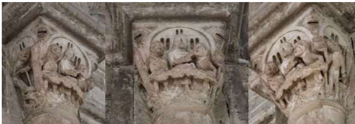
30 - La mort d'Absalon