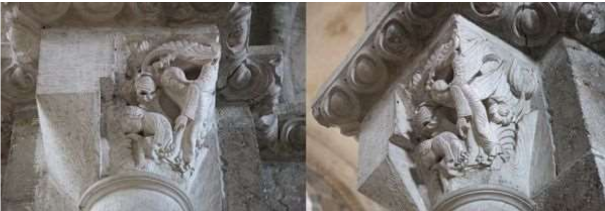
35 - Deux lions creusant la tombe de Saint-Paul devant Saint-Antoine