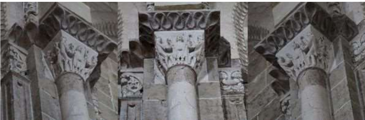
85 - Acrobate (petit cartouche de droite)